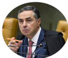
Luís Roberto Barroso Ministro do Supremo Tribunal Federal